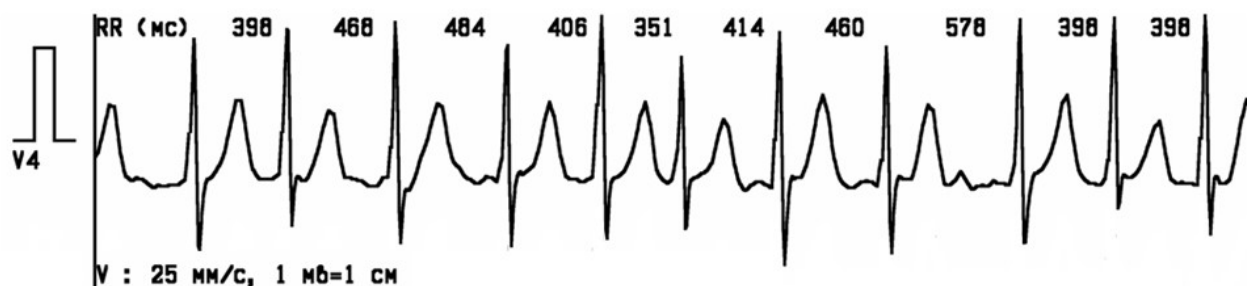
Амбулаторное (холтеровское) мониторингирование ЭКГ.jpg

За 24 часа мониторингирования зарегистрировано 11 эпизодов аритмии длительностью от 30 секунд до 12 минут: